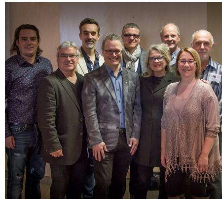
Coprésidents d'honneur et quelques patrons d'honneur Événement-bénéfice - Mars 2016