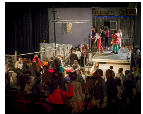
Visite des coulisses - Événement-bénéfice Mars 2016