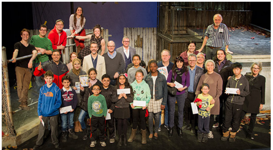
Comédiens, gagnants des prix de présence, coprésidents et patrons d'honneur - Événement-bénéfice - Mars 2016

DynamO Théâtre tient à remercier toutes celles et tous ceux qui croient en son travail et les ont encouragé à poursuivre sa mission en contribuant à ses événements-bénéfice.